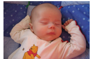
SleepTight Barnetrøster lindrer kolikk symptomene hos barnet ditt.

gir barnet et inntrykk av å ligge og sove i en bil under fart.